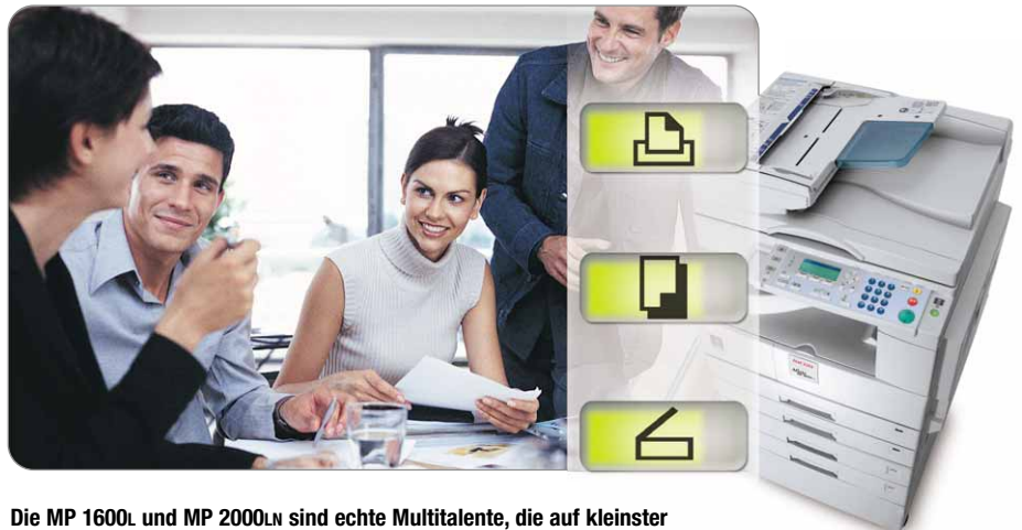
Die MP 1600L und MP 2000LN sind echte Multitalente, die auf kleinster Stellfläche drucken, kopieren und scannen.