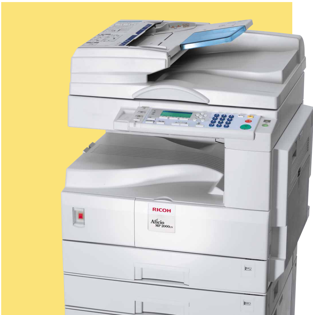
Aficio™ MP 1600L/MP 2000LN

Kopieren, drucken, scannen bis A3-Format