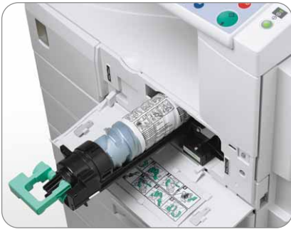
Vollständige Frontbedienung erleichtert die Nutzung und Wartung.

Professionelle Geschäftsunterlagen sind ein wertvoller Imagefaktor. Deshalb lassen der MP 1600L und MP 2000LN in puncto Qualität keine Wünsche offen. Jede Vorlage wird nur einmal kurz eingescannt. Ein Dash - der Ausdruck in beliebiger Auflage erfolgt dann aus dem elektronischen Speicher. Das gewährleistet Blatt für Blatt makellose Ergebnisse, mit denen Sie im wahrsten Sinne des Wortes Eindruck machen können.